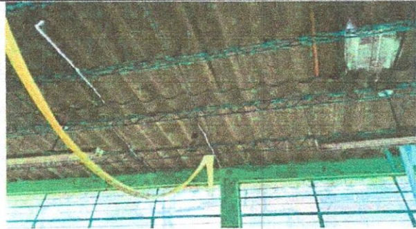
Foto1: Sustitución de estructura de soporte de techo